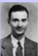
Grote Reber, qui in una immagine del 1937, nasce a Chicago, Illinois, USA, il 22 Dicembre 1911. È un radioamatore, studia ingegneria radio e lavora per varie industrie radiofoniche dal 1933 al 1947. Muore in Tasmania il 20 Dicembre 2002.

L'astronomo olandese H.C. Van den Hulst (1945) predice l'esistenza della riga di emissione a 21 cm (1411 MHz) dell'idrogeno neutro interstellare. Nel 1954, Van den Hulst, Muller e Oort ottengono la mappa della distribuzione spaziale dell'idrogeno, che evidenzia la struttura a spirale della Galassia. Questo rappresenta l'inizio della spettroscopia radio.